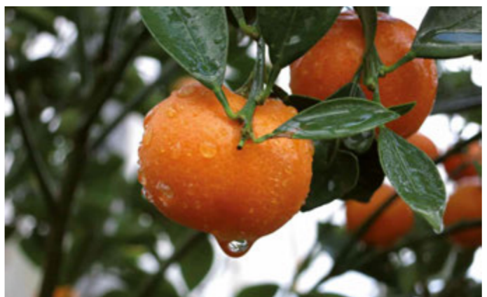
Exotisches Gewächs im Tropenhaus: die Calamondin-Orange

Der 3.500 qm² große und barrierefreie Tropengarten besteht aus einem Besucherhaus und einem angrenzenden Produktions- und Forschungsgewächshaus. Erleben Sie über 220 verschiedene Pflanzenarten und entdecken Sie Früchte, die normalerweise in Deutschland nicht erhältlich sind, wie z. B. die Naranjilla (Lulo).