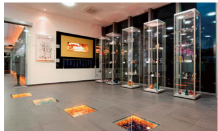
Ausstellungsraum im Glasmuseum

In einem eigens eingerichteten Museumsraum werden regelmäßig verschiedene Sonderausstellungen gezeigt.