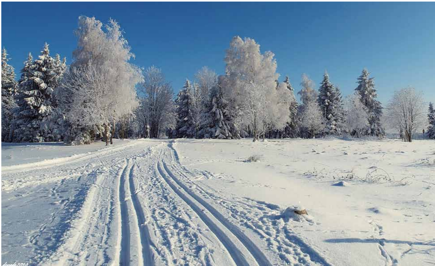
Auch im Winter einen Besuch wert: Langlaufloipen in der Rennsteigregion

Lädt zum Wandern ein: die Rennsteigregion im Frankenwald ... ist ein wahres Paradies für alle Naturverbundenen. Auf markierten Wander-, Nordic Walking-, Rad- und Mountainbike-Strecken begegnen Sie stets der reichen Geschichte, Tradition und Kultur des Frankenwaldes. Reich an Abwechslung ist auch ein Aufenthalt im Winter. Gepflegte Skipisten und Langlaufloipen ermöglichen ideale Wintersportbedingungen. Zudem zeigen Ihnen bei „Handwerk & Kultur erleben“ Traditionsunternehmen aus den verschiedensten Branchen bei spannenden Werks- und Erlebnisführungen ihre Handwerkskunst.