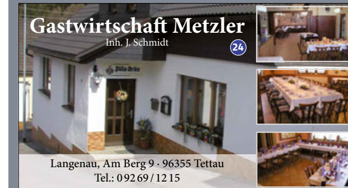
Langenau, Am Berg 9 - 96355 Tettau Tel.: 092 69 / 12 15