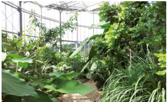
Offen für Besucher: das Tropenhaus

In Kleintettau werden seit 2013 exotische Früchte und tropische Speisefische in Bio-Qualität gezüchtet. Das Tropenhaus Klein Eden wird mit der laufend anfallenden industriellen Abwärme der benachbarten Firma HEINZ-GLAS beheizt, die bisher ungenutzt entwich.