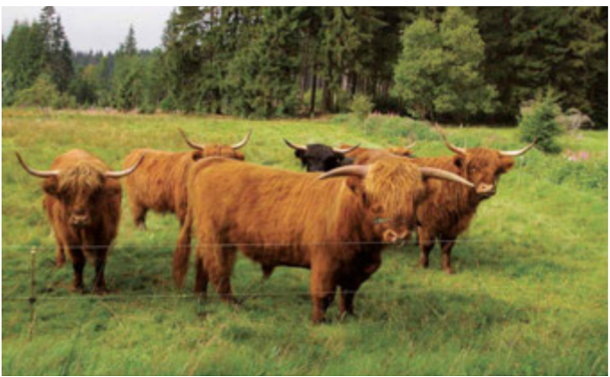
mit Auslauf im Sommer

„Highland-Cattle“ – die schottischen Hochlandrinder am Rennsteig sind seit den 1980er-Jahren zu einem festen Bestandteil in der regionalen Landwirtschaft und zu einem echten Blickfang geworden. Erfahren Sie bei einem Besuch Wissenswertes über die Geschichte und die besondere Haltung oder informieren sich auf den an den